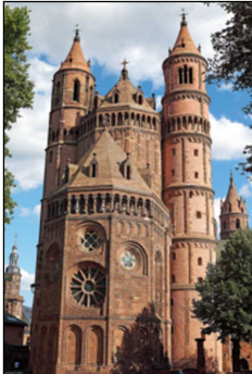
Abbildung 1: Dom St. Peter in Worms

Unsere diesjährige Herbstexkursion führt uns von Donnerstag, 5. September, bis Sonntag, 8. September 2019 , nach Rheinland-Pfalz, an den Rand des Pfälzer Walds. Im Zentrum des Programms werden die Kaiserdomen in Speyer und Worms stehen, die neben Mainz zu den bedeutendsten Bauwerken der romanischen Architektur gehören. Ihre Umgebung im nordwestlichen Oberrheingebiet gehörte zum Stammland und zur Machtbasis der salischen Kaiser. Mit einer Gesamtlänge von 133 Metern war der Speyrer Dom bis zum Bau der Peterskirche in Rom die grösste Kirche der Christenheit. Worms ist bekannt als Nibelungen- und Lutherstadt und war – wie auch Speyer – ein wichtiger Ort jüdischer Kultur in Deutschland. Zudem war Worms Tagungsort von vier Reichstagen und zwei Hoftagen. Der Wormser Dom ist Grablege der Familie Kaiser Konrads II.